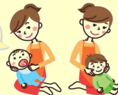
1歳を過ぎるころからは、寝かせてみがきます。