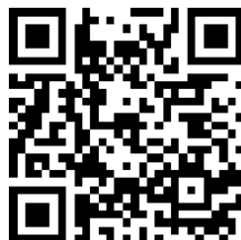
申込みフォーム QR コード