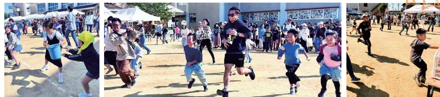
2位景品ゲットで大喜びの子どもたち

~2025年度開催予定日~ さやりんフェスティバル 6月22日(日) さやりんピック 11月2日(日)