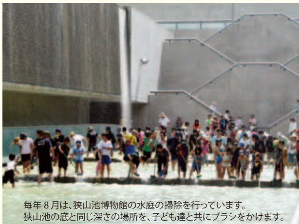
毎年8月は、狭山池博物館の水庭の掃除を行っています。狭山池の底と同じ深さの場所を、子ども達と共にブラシをかけます。