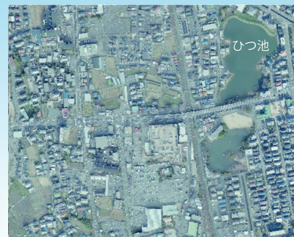
ひつ池 ●堤長:218m ●堤高:2.7m ●貯水量:22,800m³ ●所在地:金剛2丁目9-1

この「ため池ハザードマップ」は「ひつ池」が決壊した場合に想定される浸水区域や水深、および避難に役立つ情報をとりまとめたものです。災害のおそれがあるときの情報収集や、災害時の避難行動に役立ててください。