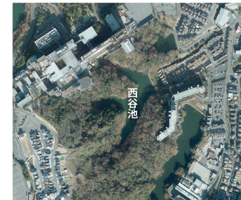
西谷池 ●堤長:70m ●堤高:9.4m ●貯水量:39,900㎡ ●所在地:菜葉木8丁目1589-1

この「ため池ハザードマップ」は「西谷池」が決壊した場合に想定される浸水区域や水深、および避難に役立つ情報をとりまとめたものです。災害のおそれがあるときの情報収集や、災害時の避難行動に役立ててください。