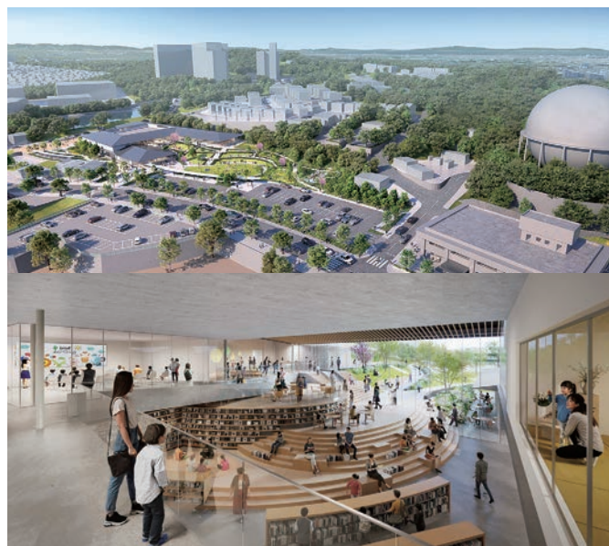
※イメージは、提案時点での計画であり、今後、市との協議により一部変更となる可能性があります