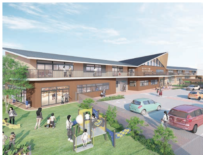
※イメージは、提案時点での計画であり、今後、市との協議により一部変更となる可能性があります