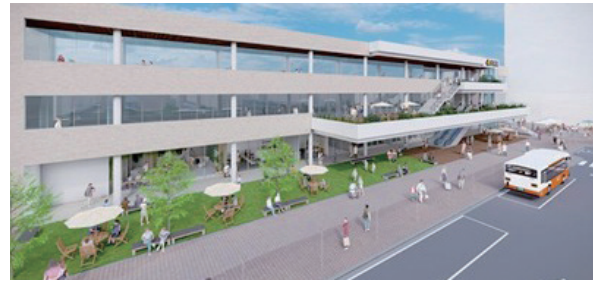
◀現時点での金剛駅リニューアル後のイメージ

市は、3月30日に南海電気鉄道(株)(現・株NANKAI)、富田林市と金剛駅周辺地区再整備事業を官民共同で推進することに合意し、「金剛駅周辺地区再整備事業の実施に関する基本協定書」を締結しました。協定書の締結に伴い、3者は金剛駅周辺の一体的な再整備事業の実施に向けた取り組みを進め、令和13年度中の商業施設部分の開業、令和15年度中の全面リニューアル完了をめざします。