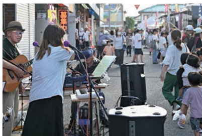
未来を育むふれあいまつり

とき 2月20日(金)午後7時～8時30分 ところ 市立コミュニティセンター・音楽室 内容 プロジェクトの説明と顔合わせ、意見交換