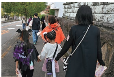
謎解きウォーキング