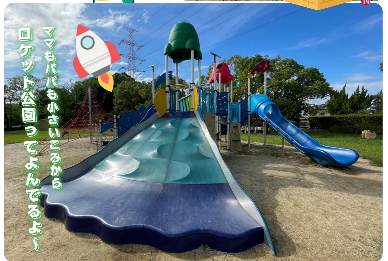
📍 大野台第6公園 14 ロケットをモチーフとした大きな遊具が！ピラミッドもあるよ～！