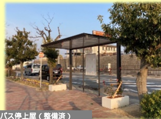
副池前バス停上屋（整備済）