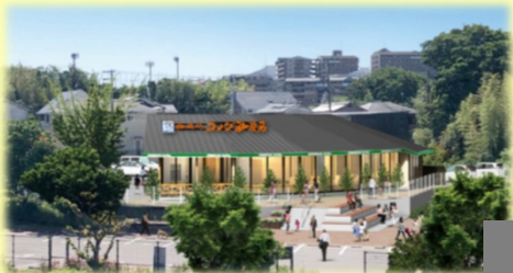
コメダ珈琲店 狭山池店 整備後の参考イメージ

公民連携により設置した公園内の喫茶店（公園施設）です。令和4年4月15日（金）～21日（木）は短縮営業（7：00～17：00）、令和4年4月22日（金）以降は通常営業（7：00～22：00）となる予定です。