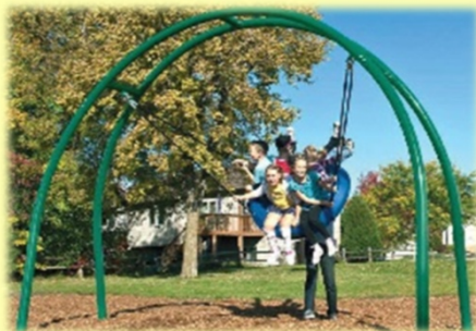
ちびっこ広場 整備後の参考イメージ