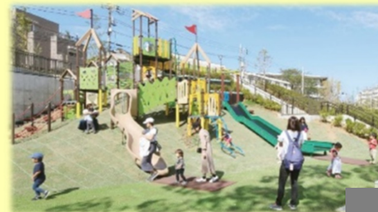
あそびの丘 整備後の参考イメージ