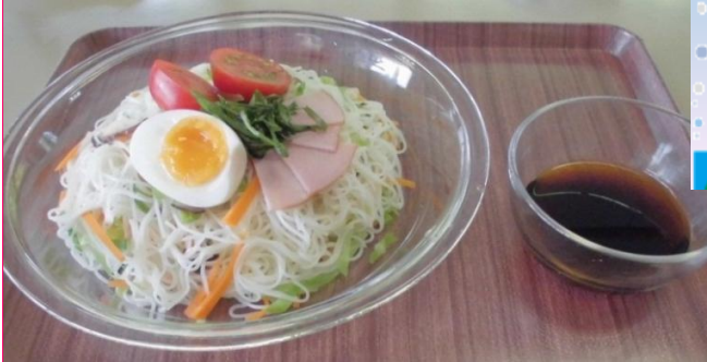
大阪狭山市食生活改善推進協議会レシピより