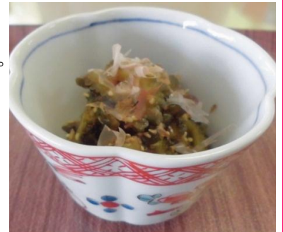
H24年度大阪狭山市健康まつりレシピより